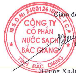
Hương Xuân Công