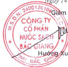
Hương Xuân Công