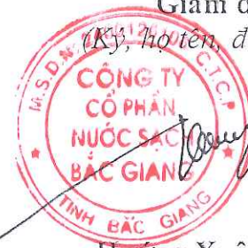
Hương Xuân Công