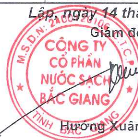
Hương Xuân Công